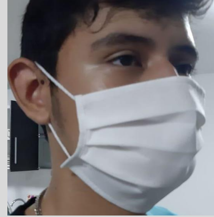
Caja de 50 unidades